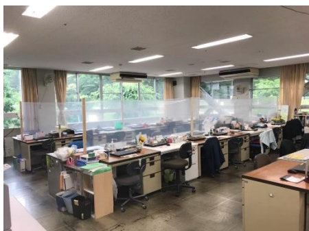
職員室にビニールシールドの設置