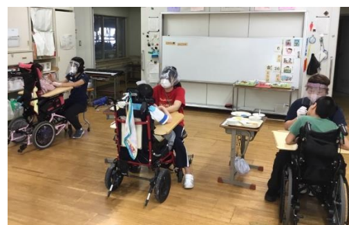
対面で支援するA部門の教職員は「フェイスシールド」の着用