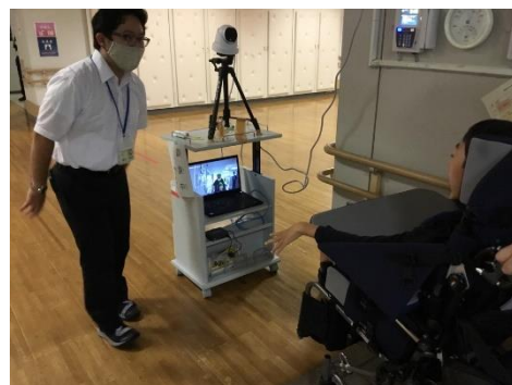
校舎に入る前に検温 「サーモグラフィ」の活用

東京都教育委員会 Tokyo Metropolitan Board of Education