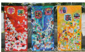
美術で作った装飾